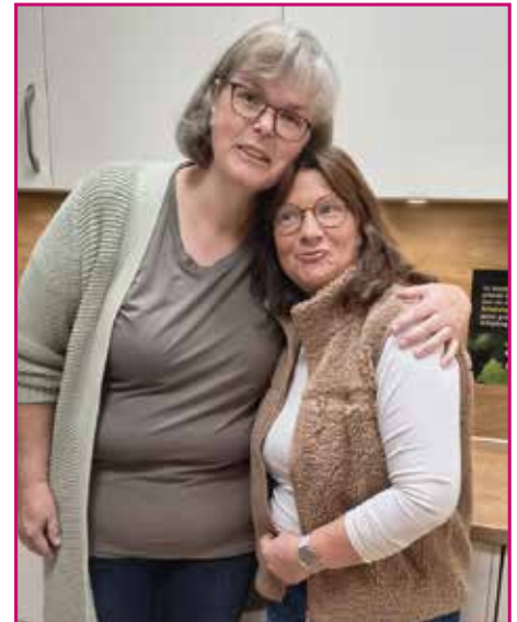
Die Gruppe "Doon deit lehren" hatte sehr leckere Suppen vorbereitet, die gut ankamen.