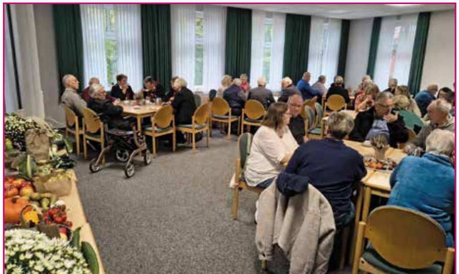
Erntedank wurde in unseren Gemeinden mit Gottesdiensten und einem anschließenden Beisammensein gefeiert.